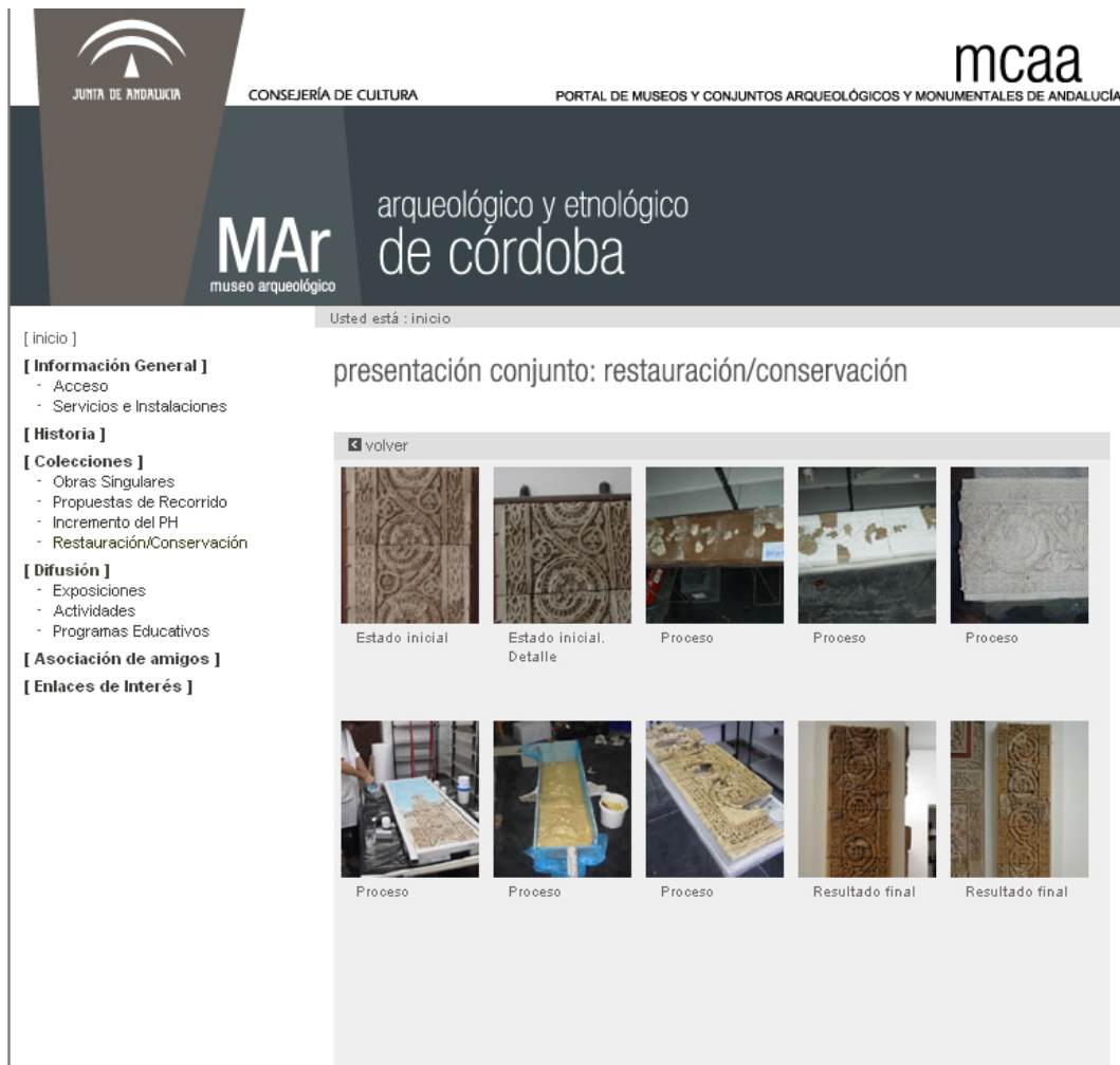
Proceso de restauración de la jamba de un ataurique en la sección Restauración del Museo Arqueológico y Etnológico de Córdoba

Por otra parte, en las páginas web de los conjuntos arqueológicos y monumentales, se diferencia entre bienes muebles y piezas singulares, mostrándose ambos con una imagen de gran tamaño, además de su correspondiente ficha informativa. También para los conjuntos se propone un recorrido comentado e información actual detallada de los incrementos de patrimonio y de las restauraciones.