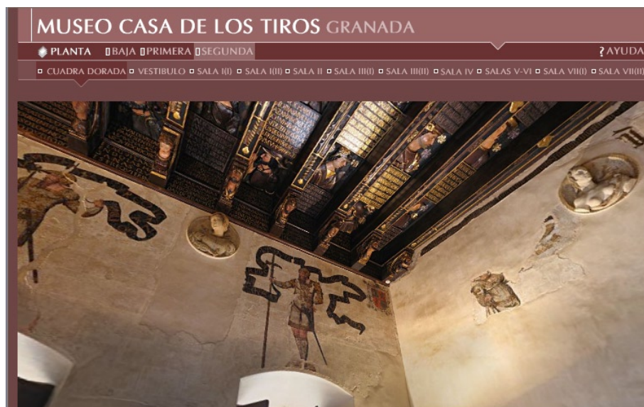
Fotografía esférica de la Cuadra Dorada del Museo Casa de los Tiros

Una fotografía panorámica no es más que un número determinado de fotografías fijas que se toman moviendo la cámara en torno a un eje vertical hasta llegar a los 360° del giro completo. Estas tomas se unen después mediante un software en una sola imagen continua que permite recorrerla a izquierda y derecha, en círculo, moviendo simplemente el ratón del ordenador.