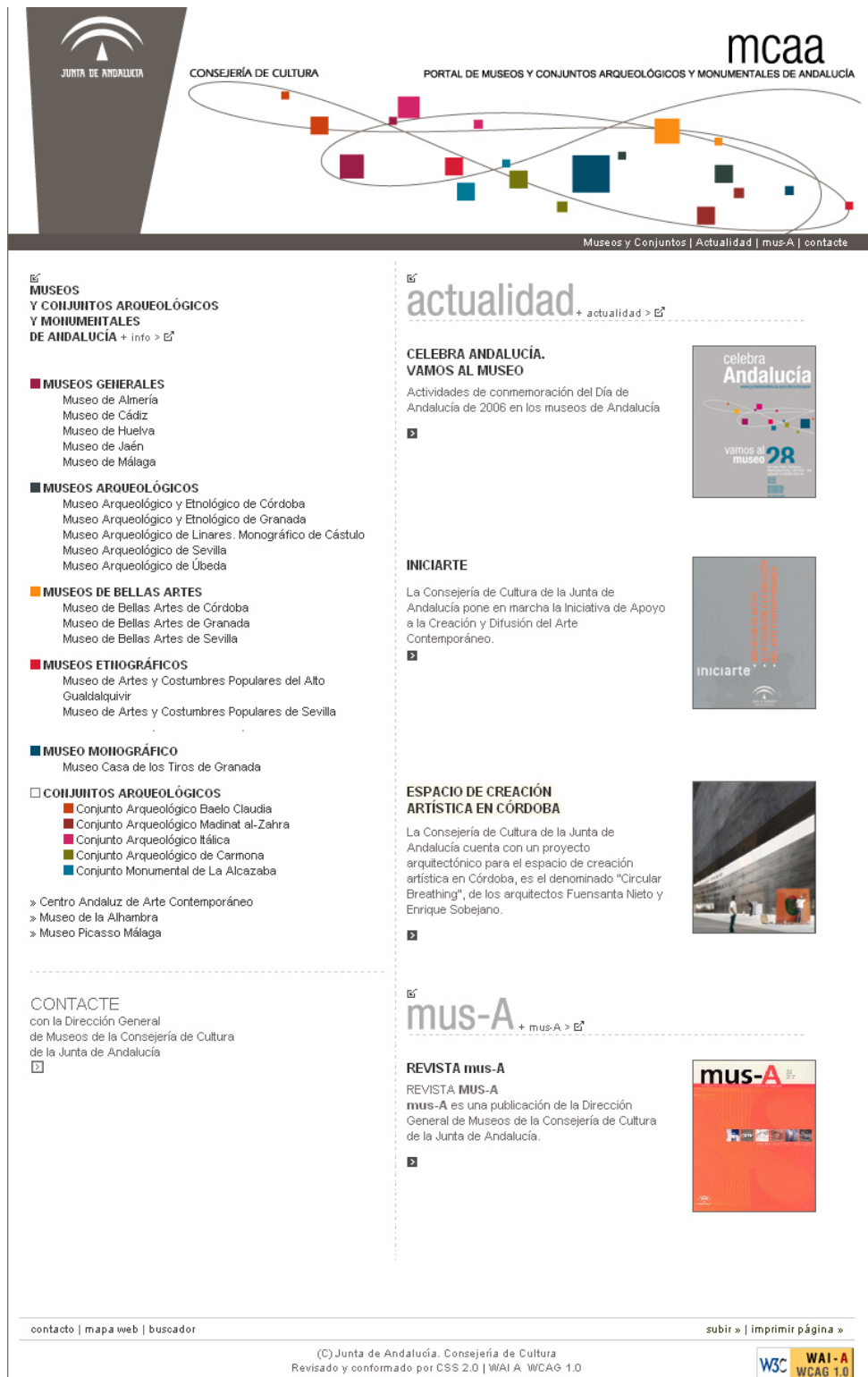
Pie de imagen: Página de inicio del Portal de Museos y Conjuntos Arqueológicos y Monumentales de la Consejería de Cultura de la Junta de Andalucía