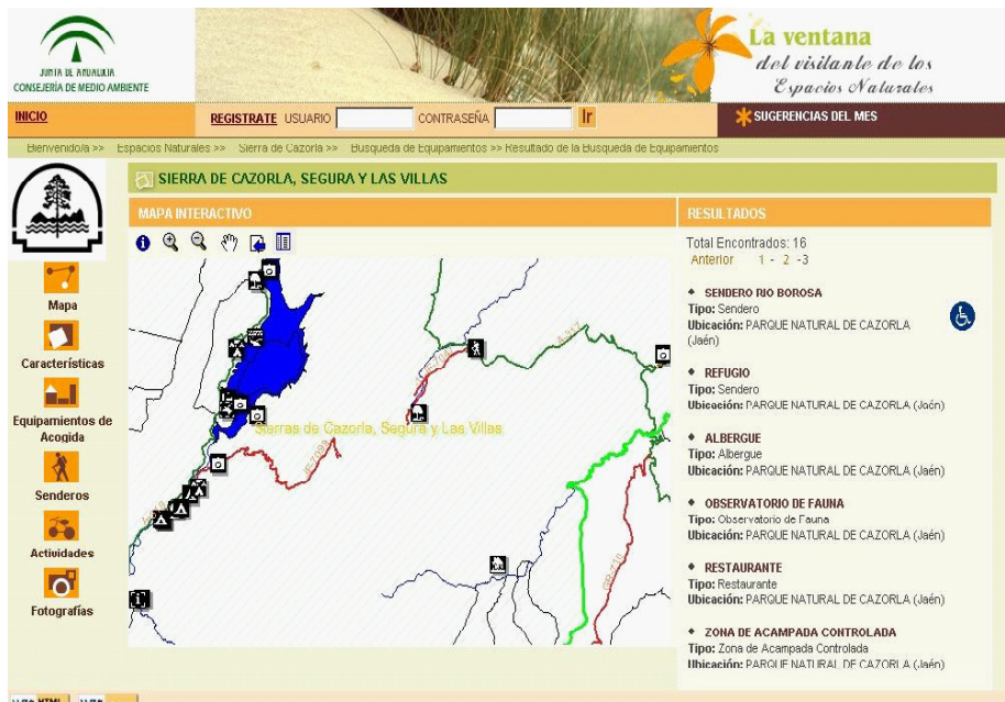
Ejemplo de pantalla de resultados de la búsqueda: