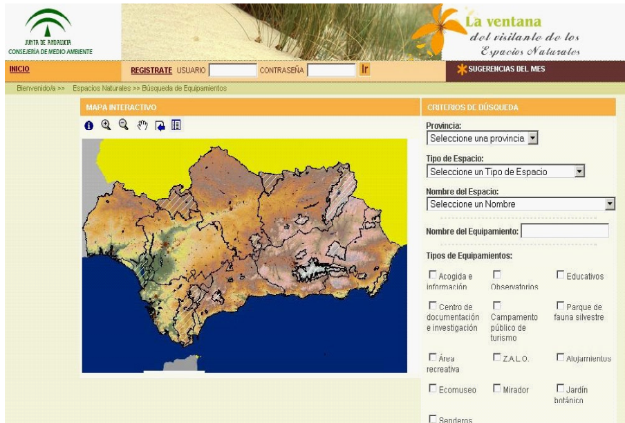
Pantalla de búsqueda de equipamientos de Uso Público: