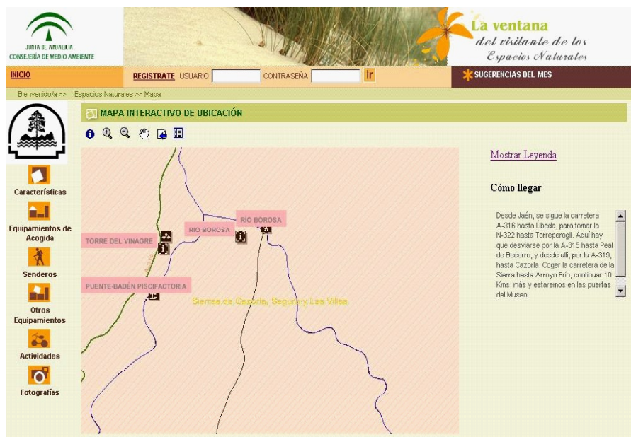
Pantalla de consulta interactiva de la cartografía de un Espacio Natural Protegido (3/3)

Búsqueda de Equipamientos: El portal ofrece diversas posibilidades para la localización de un determinado equipamiento de uso público o de un conjunto de ellos, mediante una serie de herramientas de búsqueda que permiten combinar o utilizar de forma independiente criterios de búsqueda alfanuméricos y geográficos (los geográficos apoyados en un servicio de mapas). Entre ellas cabe destacar la posibilidad de que definiendo un punto origen sobre un mapa o de forma alfanumérica y una distancia en kilómetros como radio, el portal devuelva el conjunto de espacios naturales protegidos y equipamientos de uso público que se encuentran contenidos en el mismo.