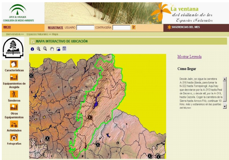
Pantalla de consulta interactiva de la cartografía de un Espacio Natural Protegido (1/3)

Publicación de información de los Espacios Naturales Protegidos de Andalucía: No puede ser ajena la publicación de la oferta de equipamientos de uso público, de los Espacios Naturales protegidos en los cuales se encuentran. A través del portal se publicará información de interés de los diversos Espacios Naturales Protegidos, los cuales estarán relacionados con los equipamientos de uso público que se ubican en los mismos. Además, se va a habilitar al ciudadano la posibilidad de hacer consultas interactivas sobre la cartografía de un Espacio Natural Protegido.