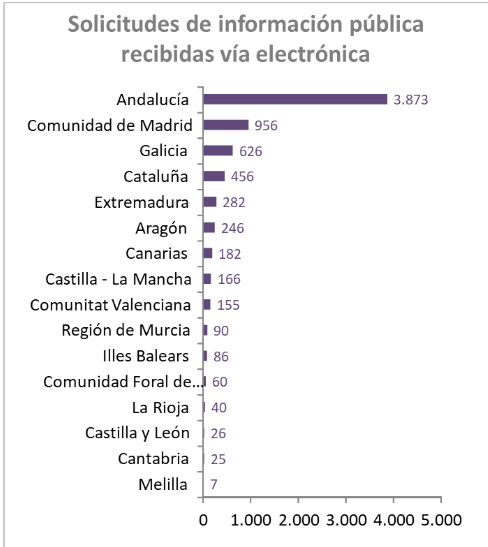
Gráfico 2. Solicitudes de información pública recibidas vía electrónica (unidades).