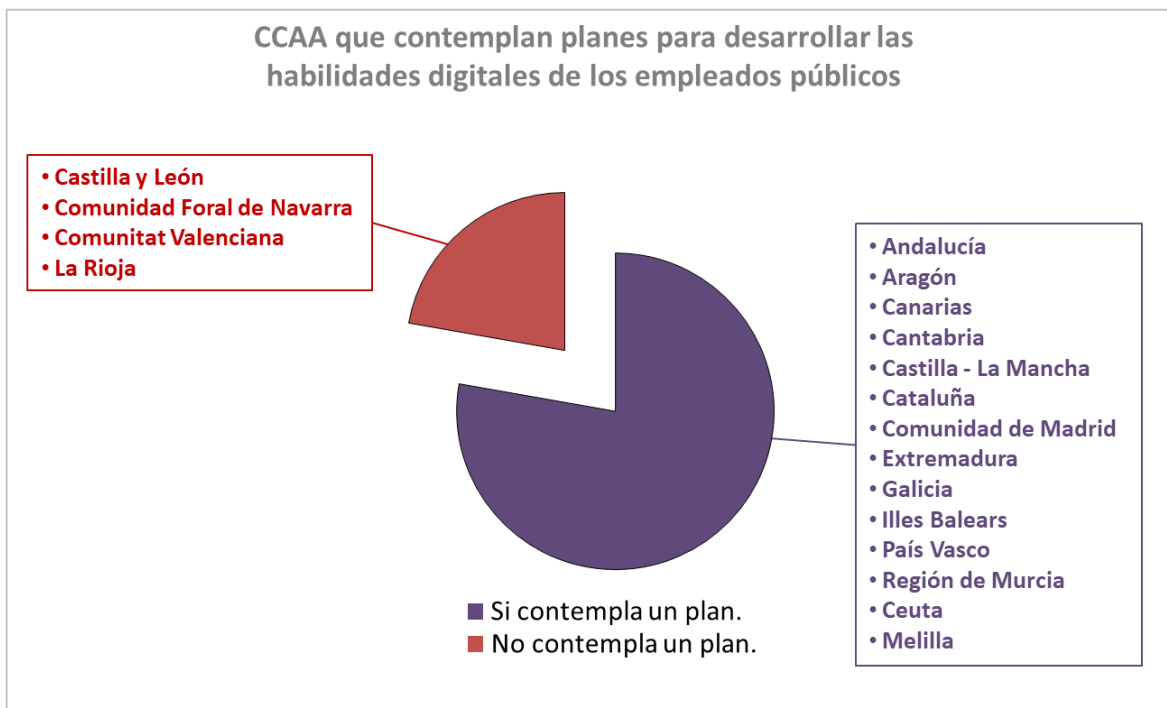
Gráfico 15. CCAA que contemplan planes para desarrollar las habilidades digitales de los empleados públicos.